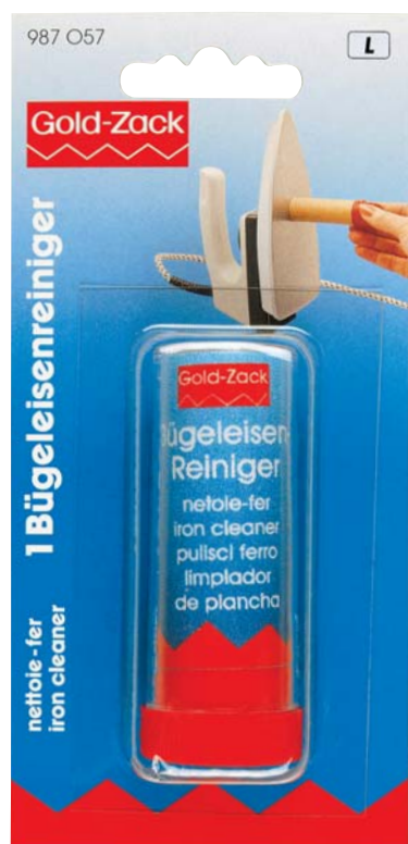
A Originalgröße 67 x 185 mm