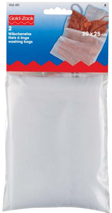
C Originalgröße 110 x 235 mm