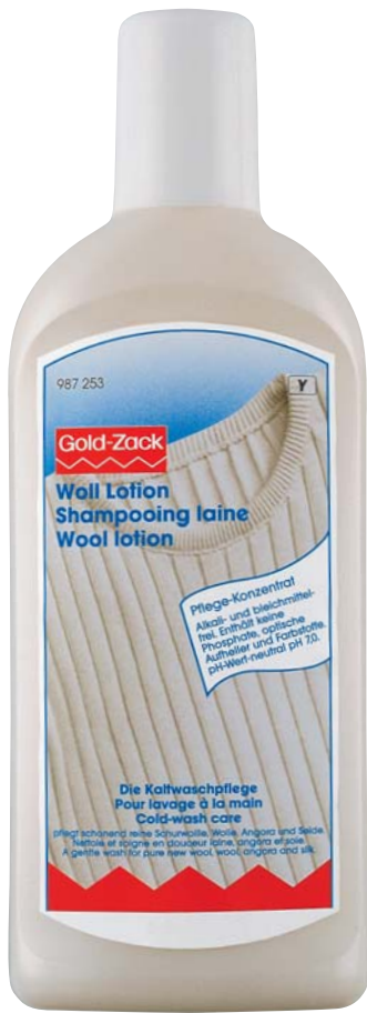
D Originalgröße 85 x 240 mm