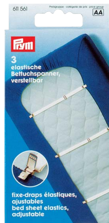
C Originalgröße 67 x 140mm