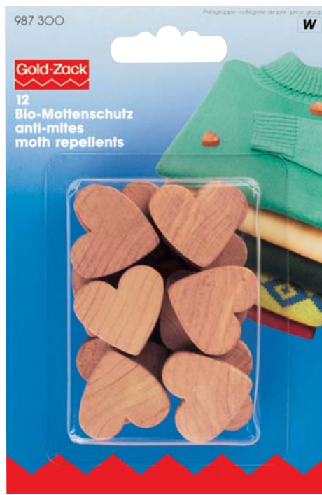
E Originalgröße 93 x 140 mm