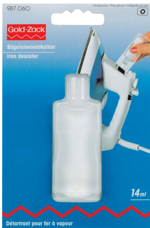
B Originalgröße 93 x 140mm