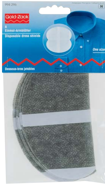
B Originalgröße 110 x 185 mm