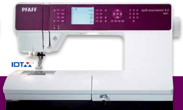
quilt expression™ 4.2